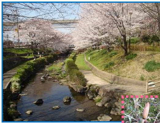
白沢溪谷とサクラ ❀❀ ↑↑