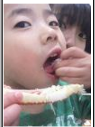
はじめての 蟹にハマる...