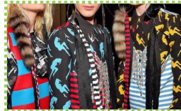
↑「タッキー柄」 わざとダサ可愛くするみたい。

川には「微笑橋」という吊り橋が架けられていました。なんてロマンチックな名前♡▽♡でも、木の吊り橋なので、結構スリリング(=°ω°=;) マジ!?この橋の下は滝になっていて、街中の公園とは思えないワイルドな景観で「白沢溪谷」と呼ばれているそうです。園内には芝生の広場もあったので、ここでピクニックです。水面にサクラが映りこんで、とってもきれいでしたよ。子どもが遊べる広場や遊具もあって、楽しく過ごせました（★>U<★）