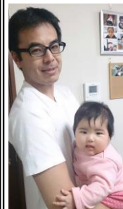
娘が5か月になりました (^_^)