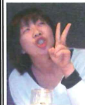
友達と食事して 上機嫌〜♪笑