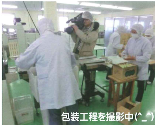
包装工程を撮影中(^_^)